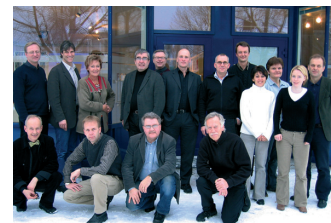
Gruppbild från en workshop med pilotkommunerna Orsa, Hällefors, Laxå och Västervik.